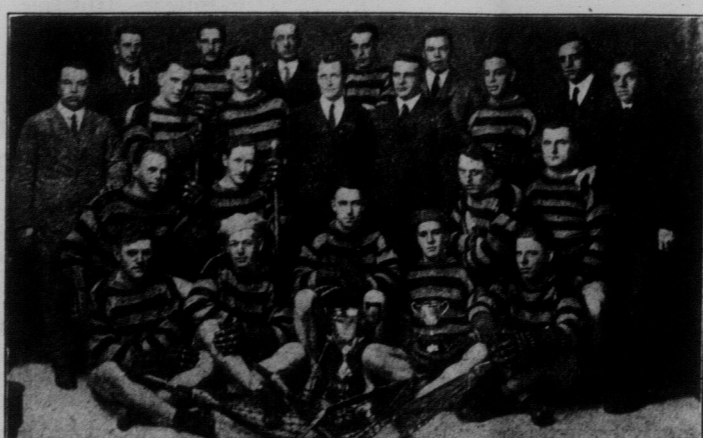
CLUB LAURIER — CHAMPIONS 1923-24-25