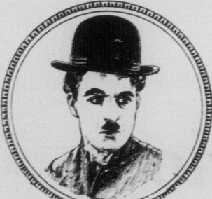
Charlie Chaplin dans "The Gold Rush", au théâtre Régent.

Il y aura une matinée spéciale pour les enfants samedi matin le 3 octobre à dix heures. Chaque enfant recevra gratuitement et devra porter une petite moustache à la Chaplin que distribuera la gérance. Tous les enfants sont invités. L'admission ne sera que de 15 sous. Les adultes seront admis à raison de 25 sous.