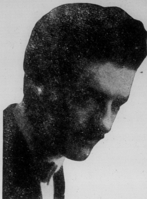
BLACKSTONE, le plus grand magicien du monde qui sera au théâtre Russell pour une semaine à partir de lundi soir prochain, avec matinées mercredi et samedi.