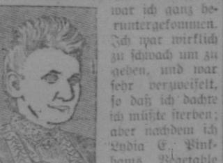
Portrait of a woman, likely the author of the article.