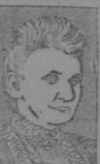
Portrait of a woman, likely the author of the article.