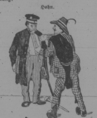
— Andere Ursache. Die Mädchen...