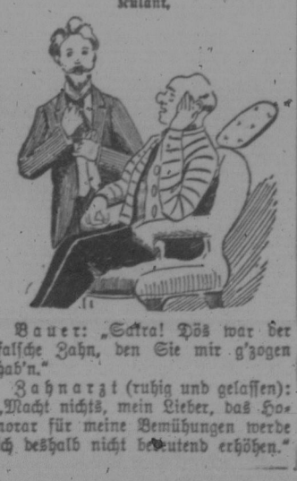
— Andere Ursache. Die Mädchen...