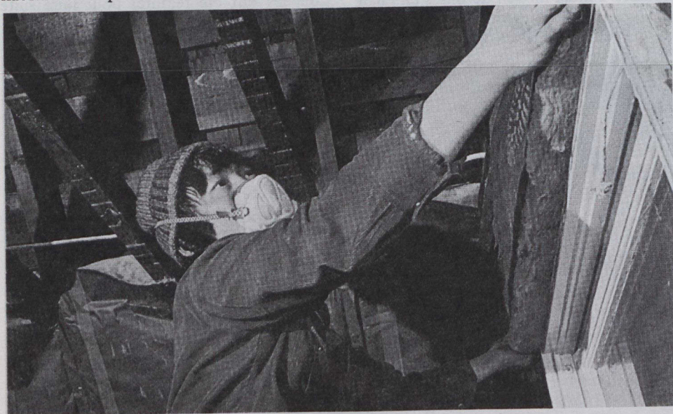
Le Programme d’isolation des résidences, dans l’Île-du-Prince-Édouard et en Nouvelle-Écosse, et le Programme d’isolation thermique des résidences canadiennes offrent une aide financière aux Canadiens voulant améliorer l’isolation thermique de leurs maisons.

Les nouvelles dispositions relatives aux logements sans but lucratif ont été annoncées (suite à la page 4)