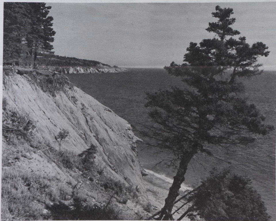
Paysage typique de la côte au cap Breton. La Nouvelle-Écosse possède 7 442 km de côtes.

C'est la première fois que la Rencontre aura lieu en dehors de l'Écosse. La Reine mère, Sa Majesté la reine Elizabeth, présidera les cérémonies d'ouverture qui auront lieu le 28 juin à Halifax.