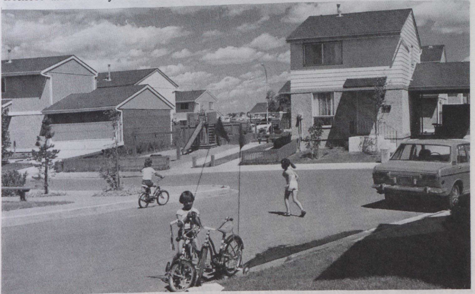
Dans cet ensemble d'habitations, les prix sont demeurés peu élevés, grâce aux décrets municipaux permettant la construction sur des terrains à utilisation maximale.

Le rapport attribue cette augmentation du volume de financement par le secteur privé aux politiques du gouvernement qui ont encouragé le secteur privé à investir plus de capitaux dans la construction résidentielle, en vue de remplacer les sommes traditionnellement fournies par des prêts directs du gouvernement, lesquelles ont été réduites pour faire suite