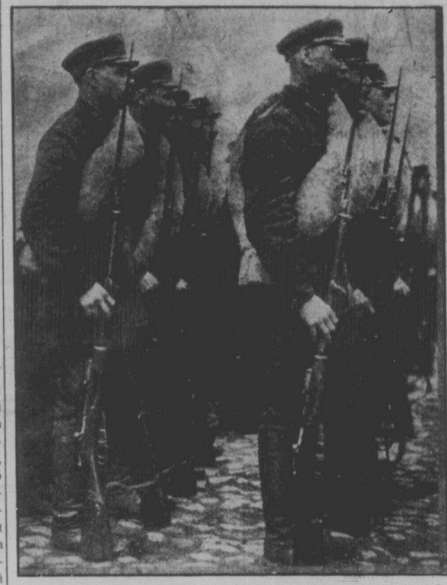
Молоді призovníки-червоноармієці, вишикувані в ряди — оборони здобуттів Жовтня й борці за всесвітній Жовтень. Першого травня в СРСР вони машерують на чолі демонстрацій пролетаріату й присягають обороняти здобутки революції та боротися за всесвітню революцію.