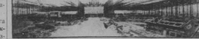
Загальний вигляд складального цеху, 2,000 футів довгий, в якому будуть складатися автомобілі. Це є частина автомобілевої фабрики в Нижнім Новгороді, СРСР, яка видаватиме 140,000 автомобілів на рік.

Хай живе світова соціалістична революція!