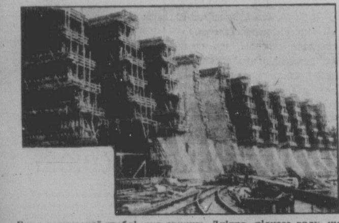
Біли величезної греблі, яка спинить Дніпро, піднесе воду, що заале Дніпрові пороги, пустить воду на турбіни, що дадуть величезну електричну силу, та пустить по Дніпру кораблі від Чорного моря до Києва. Тільки звільнене з царсько-поміщицької неволі трудяще населення України під радянською владою переборало всі труднощі й запрягає силу прироби собі на службу.