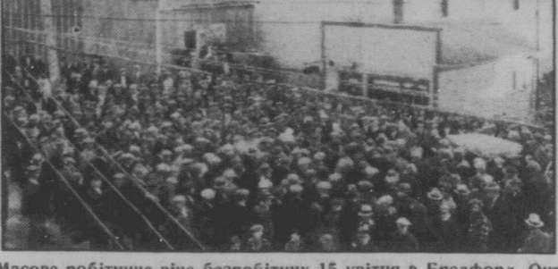
Масове робітничче віче безробітних 15 квітня в Бредфорд, Онт.

Роздей, Алта. — Я працював у Вейлі в маленькій майні Стеррінга Ірвіда. Працював я там як простий робітник в бас карі. Мав заробітної плати $4.65. На 15 квітня було масове віче в Дромелер за підтримку соціального забезпечення для безробітних на кошт держави. Я теж пішов на це віче, щоб і підтримати справу домагання безробітних. Слідуючого дня я йшов вже до праці, коли мені на зустріч прийшов бос і повідомив мене, що я з роботи звільнений. Писав мені до більшовиків за роботою. Значить, робітників не мають навіть права в отому панському ладі відімунуватись за собою, не сміють стати на оборону одні одним. Коли робітник виміється за куском хліба, його зараз проганять від праці. Та оті домагання капіталістичної класу спонити класові бої або їх послабити не вдадуться. Робітники не більше змінять свої сили і поведуть не впертий вимірний боротьбу. I. M.