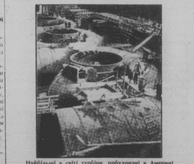
Найбільші в світі турбіни, побудовані в Америці для Дніпрельстану.

Французький фінансист Марсаль висловив свої думки про радянське збіжжя в розмові з журналістами в той спосіб: "Радянському Союзові пощастило, очевидно, піднести продукційність землі завдяки мінеральним середнякам, якими уліпшується засівна площа, та широкому застосуванню різних машин. Французькі агрономи, що приїжджають в Радянського Союзу дають, нам про це дуже докладні інформації".