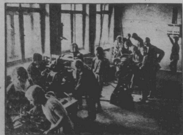
Молодь в Радянському Союзі не тільки навчається в школах, але й у фабриках коло машин набирається технічного знання, змалку прищавляється до великої суспільної праці. На powyшчому образку показано молодь в часі практичної науки коло машин.