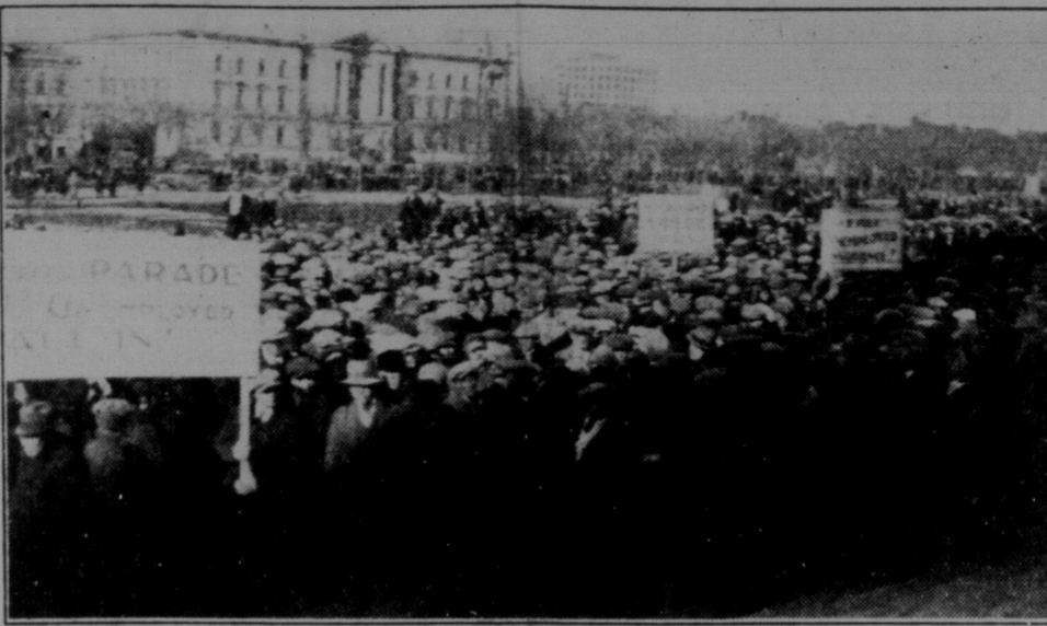
В четвер 13 березня безробітні Вінніпегу влаштували похід до провінціального парламенту, щоб домогтися від уряду "праці або платні". Делегація від безробітних предлала домогання прем'єрові Брекенові, однак він відкинув їх.