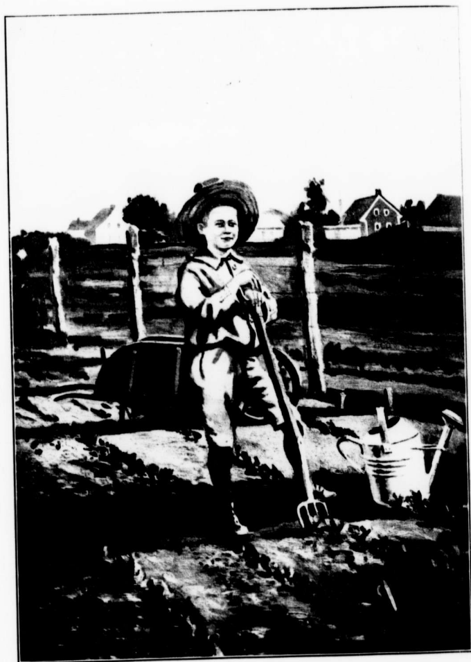
UN ÉLÈVE-JARDINIER DE ST-CASIMIR, CO. DE PORTNEUF (Voir "La rédaction à la petite école," au chapitre de la Méthodologie.)