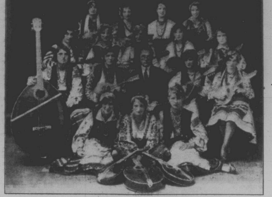
Усі учасники цієї ДМО виступлять напередодні відкриття з'їзду сьогодні, 11 липня, в майстерно зготовленій музичній програмі, народних танках і сольо-співах.