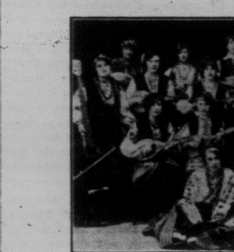
Мандолінова оркестра вінніпегського відділу ТУРФДім, що тепер подорожує в західній Канаді.

Вже в рашійній місцевій англійській газеті "Тайме" появилася звістка про прибуття до Мус Джо нашої оркестри, в якій наведено було й головні точки програми концерту. Також