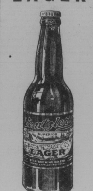
Gebraut und in Flaschen gefüllt von der STAR BREWING CO., LIMITED, North Battleford, Sasl.

Wirken für die Gemeinde die lobende Anerkennung dieser verdient.