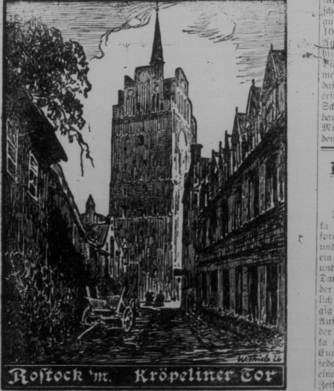
Rostock 'm. Kröpelinertor

Der Schiffer, der mit seinem Boot die salzigen Fluten der Ostsee vertritt, ist der 127 Meter hohe Turm der alten Rostocker Petrikirche zur Rechten geworden.