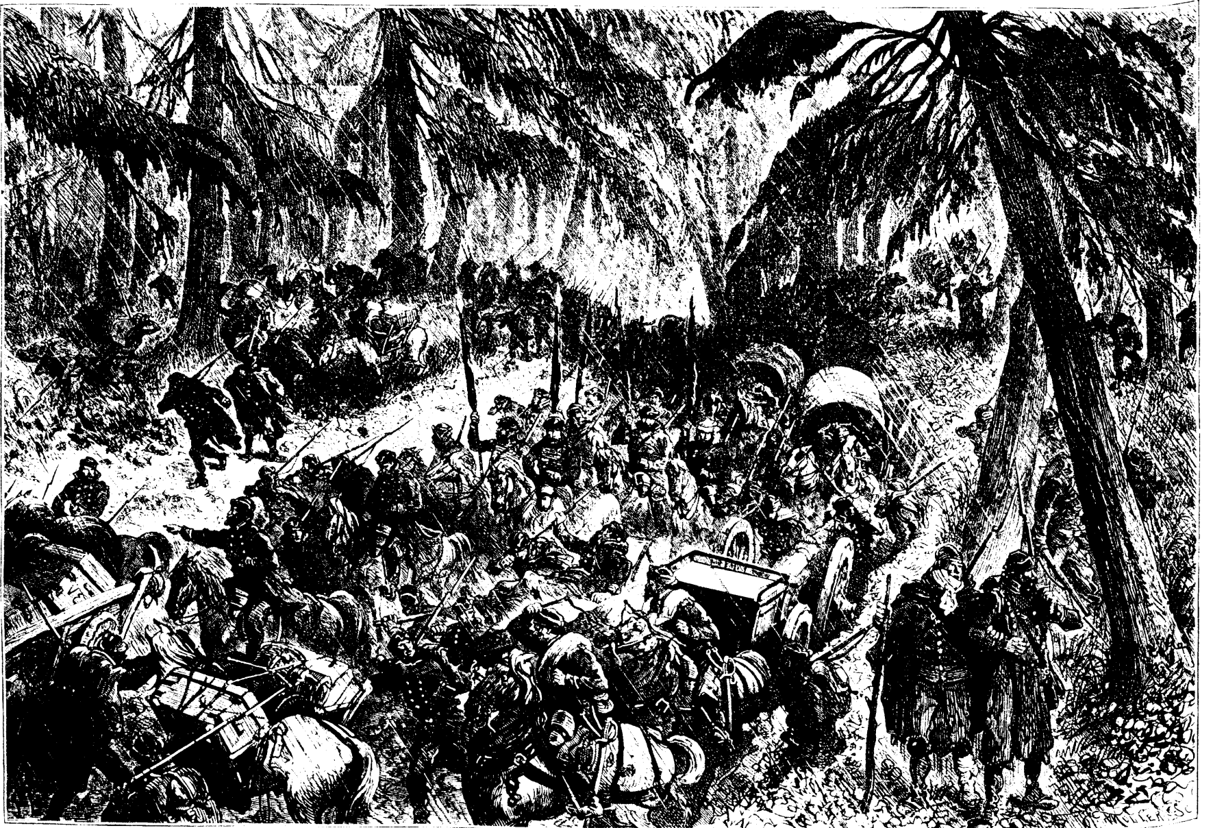
BATAILLE D'YAVOR; LA RETRAITE EVENEMENTS D'ORIENT