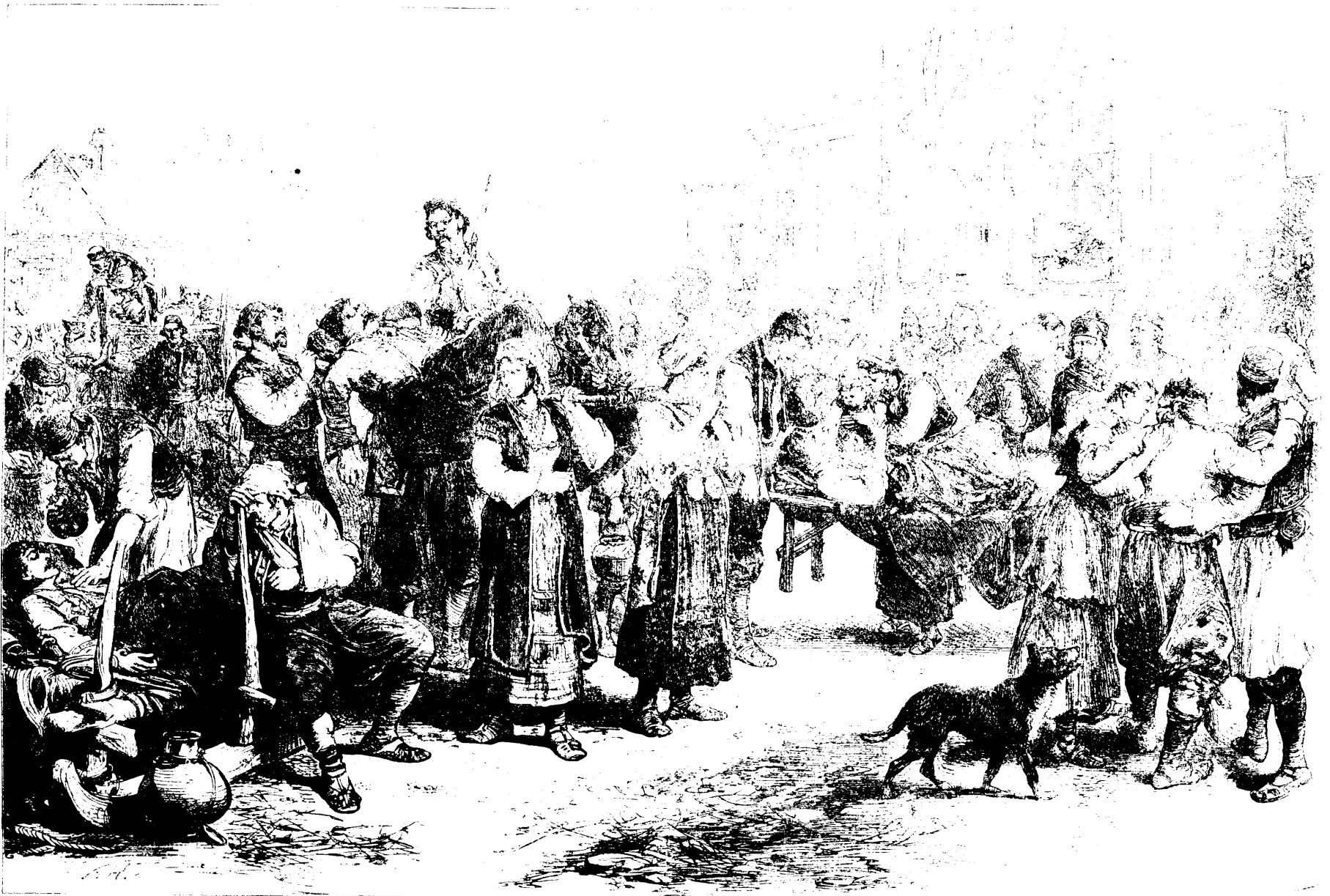
LES BLESSES TRANSPORTES PAR DES FEMMES AUX HOPITAUX D'IVANTZA