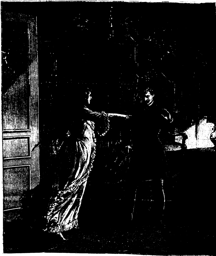
Rends-moi mon enfant ! Rends-moi mon enfant !—Page 20, col. 2

—En allant à sa recherche dans la forêt, en écoutant, il doit crier, pleurer, ce pauvre enfant. Enfin, je ne sais pas, moi, mais il faut le sauver, il le faut.