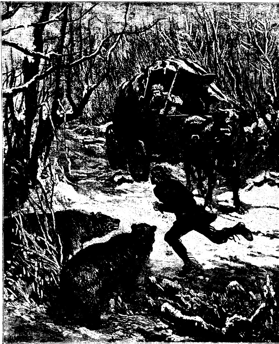
La surprise les empêcha de l'attaquer. — Voir page 390, col. 1.

Notre épouvante se change en bravoure, et bientôt notre bravoure en déception et en jactance, lorsque, ayant mis pied à terre et poursuivant nos ennemis en déroute, nous n'eûmes pas même la