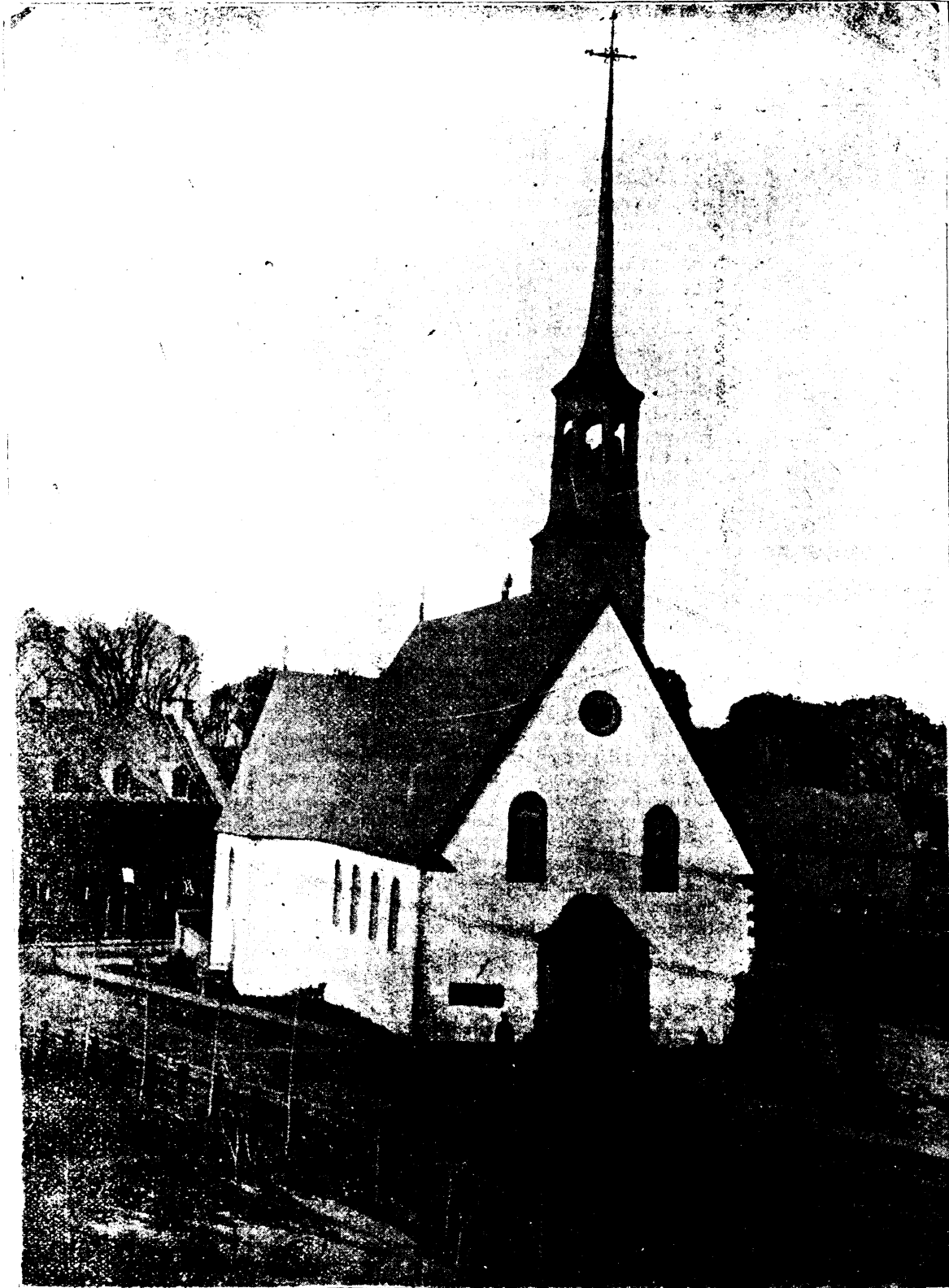
A TRAVERS LE CANADA. — L'ÉGLISE PAROISSIALE DES TROIS-RIVIÈRES

La ligne, par insertion - - - - 10 cents Insertions subséquentes - - - - 5 cents Tarif spécial pour annonces à long terme