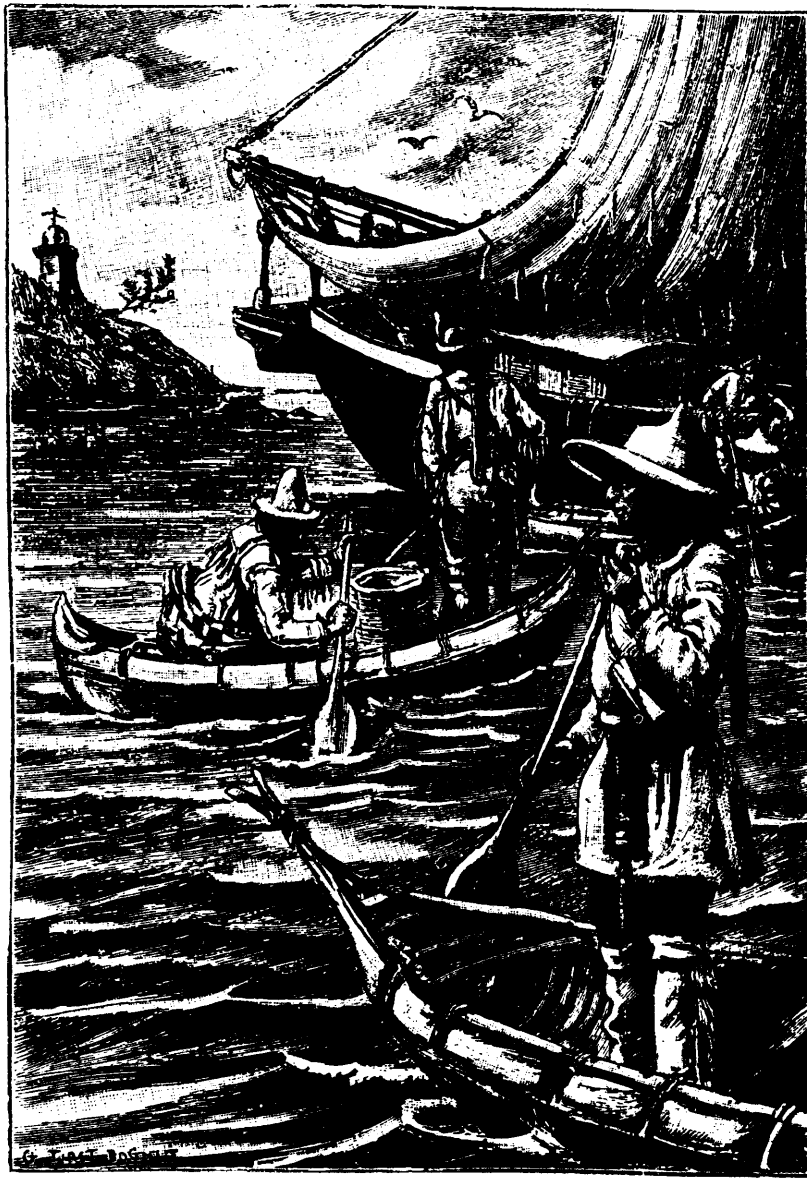
Les hommes de ces canots étaient de race indienne.—Page 20, col. 1

—Il ne me devrait rien !" —Là-dessus, les deux amis se séparèrent. Puis,