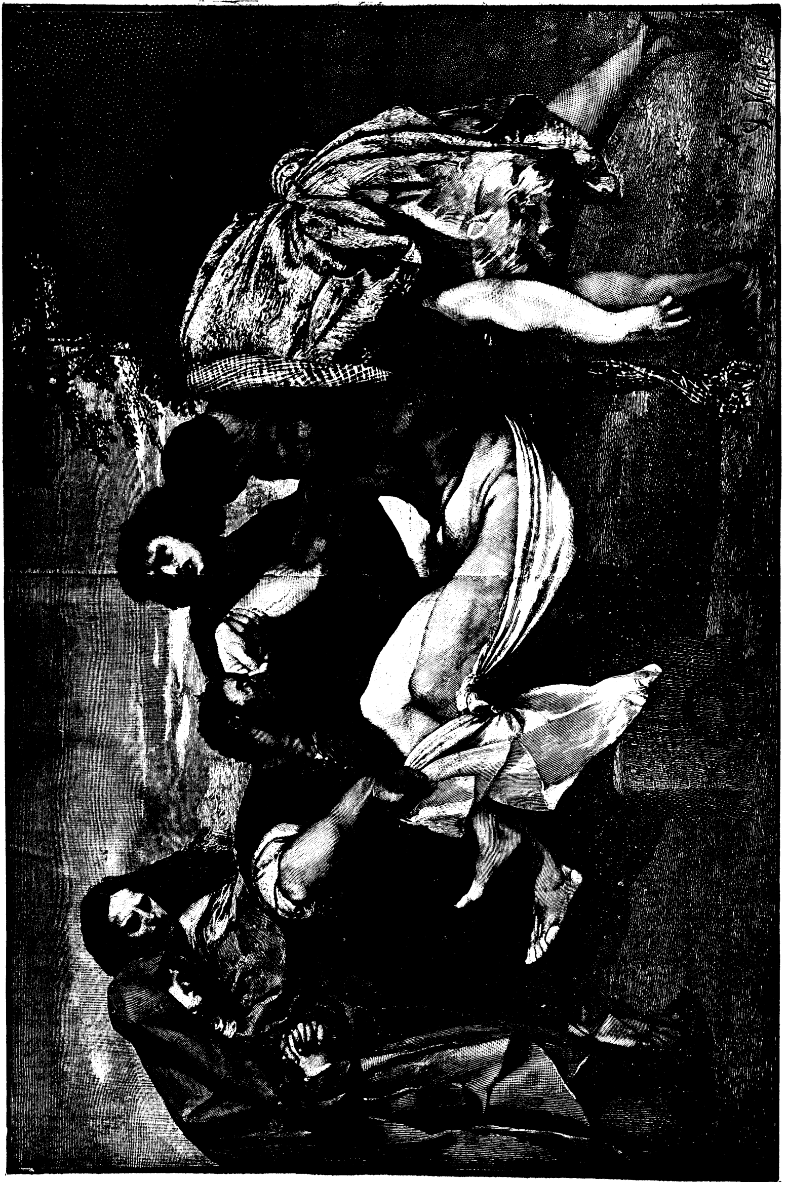
L'ENSEVELISSEMENT DU CHRIST, PAR LE TITIEN.—GRAVURE DE M. NAPIER.