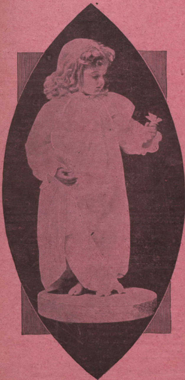
L'ENFANT AU PAPILLON

Un an - - - Quinze francs Six mois - - - 7 frs Strictement payable d'avance.