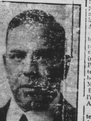
L'HON. M. KING, qui vient de terminer une tournée politique dans les Provinces Maritimes.

M. King cita Dunn et Bradstreet pour prouver la fausseté de la première déclaration. Quant à la seconde affirmation du Chef de l'Opposition il donna des chiffres préparés aux Etats-Unis pour établir que la migration des nôtres aux Etats-Unis était tombée de cinquante p. c. dans l'espace des onze derniers mois.