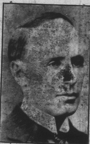
L'HON. M. MEIGHEN, chef de l'Opposition, qui a terminé hier, à Sussex, sa série de discours politiques dans les Provinces Maritimes.

Le chemin de fer; un seul fourgon sera à relier les deux wagons et ce système donne bonne satisfaction tout en permettant une économie appréciable.