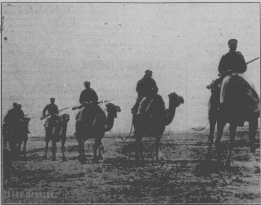
Шевченко в дорозі до орської фортеці. Це образок з фільми "Тарас Шевченко".