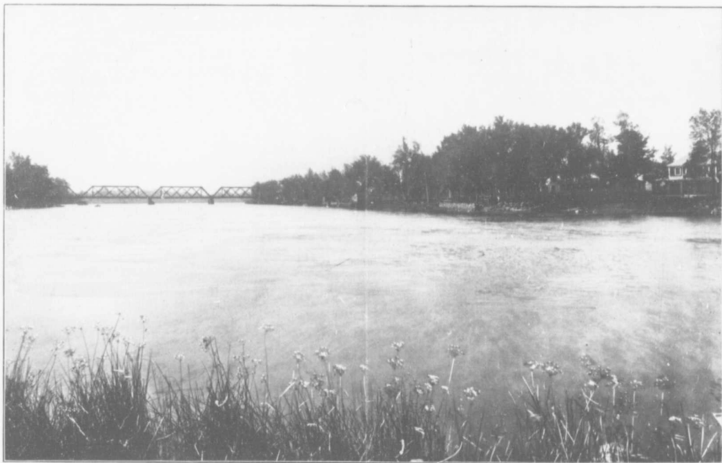
Chateauguay—Côté Ouest du Bassin et le Pont du New York Central Chateauguay—Showing the Western Shore of the Basin, and the Railway Bridge