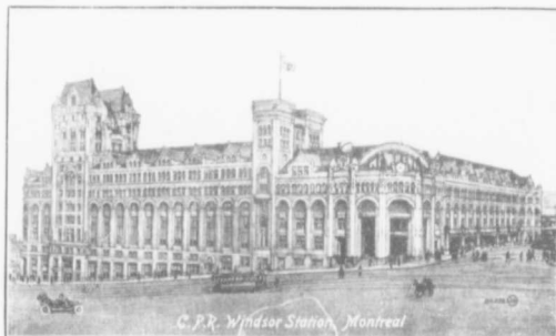
Windsor Station—The Montreal Terminus of the New York Central Railway. Gare Windsor—Le terminus, à Montréal, du chemin de fer "New York Central"

lands, a summering district which possesses more magnificent homes than any other summering place in the neighborhood of Montreal.