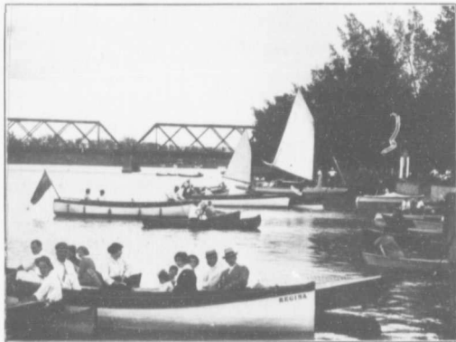
Les régattes à Chateauguay, 1913 The Regattas at Chateauguay in 1913

Me sera-t-il permis, avant d'indiquer les nombreux avantages qu'offre actuellement Chateauguay, de citer le nom de celui qui a