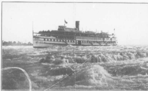
De Chateauguay à Montréal via les rapides de Lachine From Chateauguay to Montreal via Lachine Rapids

Mais nous en avons dit assez pour faire comprendre quelles sont les avantages généraux de Chateauguay—parlons un peu de ses avantages particuliers. C'est d'abord un grand et magnifique hôtel pourvu des aménagements les plus modernes, qui sera ouvert au public pour la saison d'été 1914. Des magasins généraux existent déjà ainsi qu'un bureau de poste. La banque de Montréal a déjà manifesté son intention d'y placer une succursale, et la banque des Marchands y en a ouvert une. Les pourparlers sont engagés avec les autorités ecclésiastiques au sujet de la con-