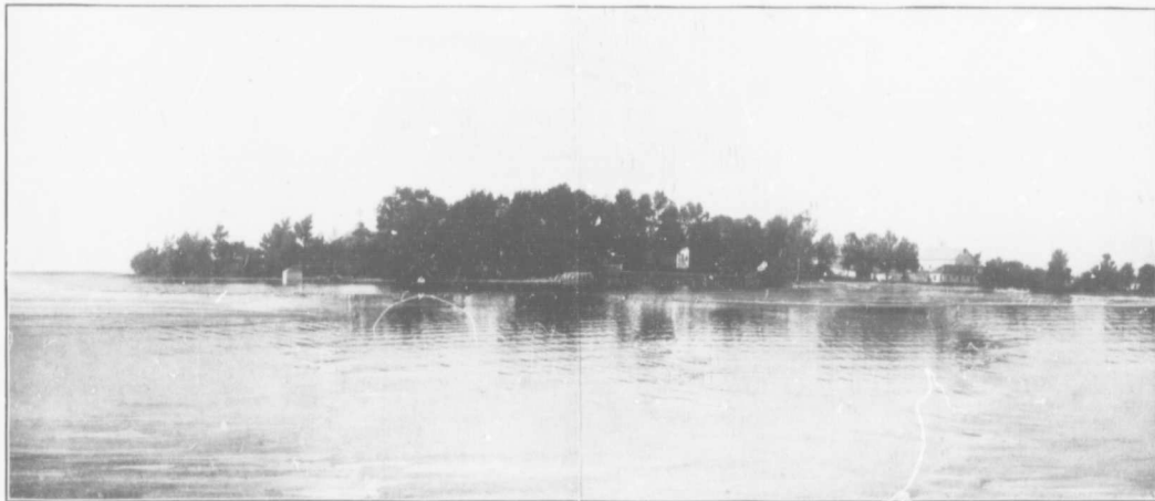
L'île-des-Sœurs, à l'embouchure de la rivière Chateauguay