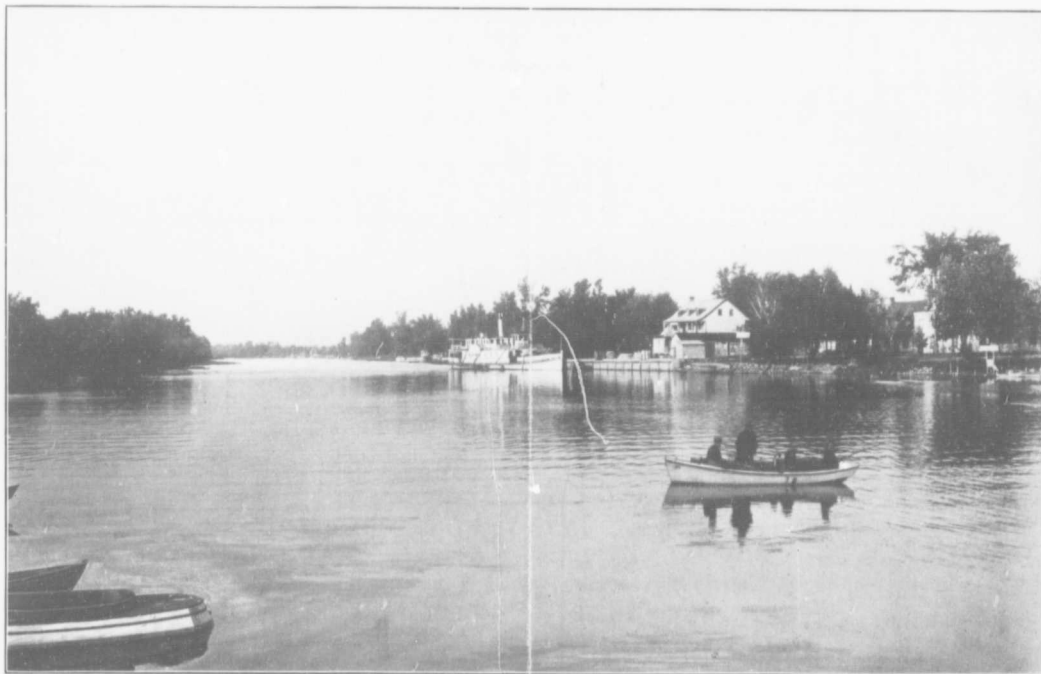
Vue du Bassin ; la Ville-Jardin à l'arrière plan

Assis dans mon canot d'écorce, Prompt comme la flèche ou le vent, Seul, je brave toute la force Des rapides du Saint-Laurent.