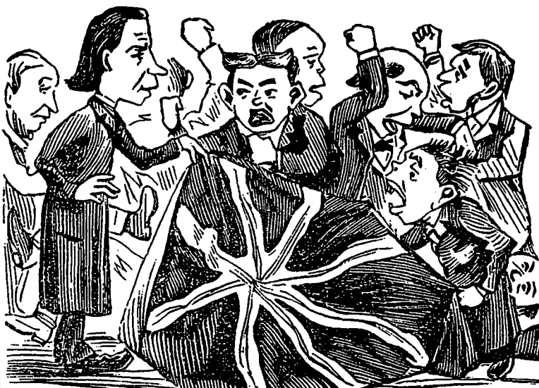
AU CLUB, CARTIER.

Nos félicitations à la famille ( Pourquoi pas au siècle qu'il a vu naître ? )