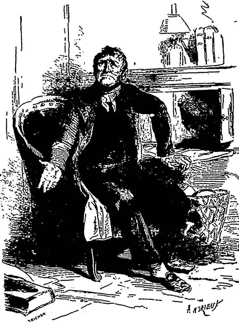
Le baron de Piombo.

— A table ! à table ! s'écria le baron en présentant sa large main à Ginevra qu'il nomma signora Piombellina, autre symptôme de gaieté auquel sa fille répondit par un sourire.