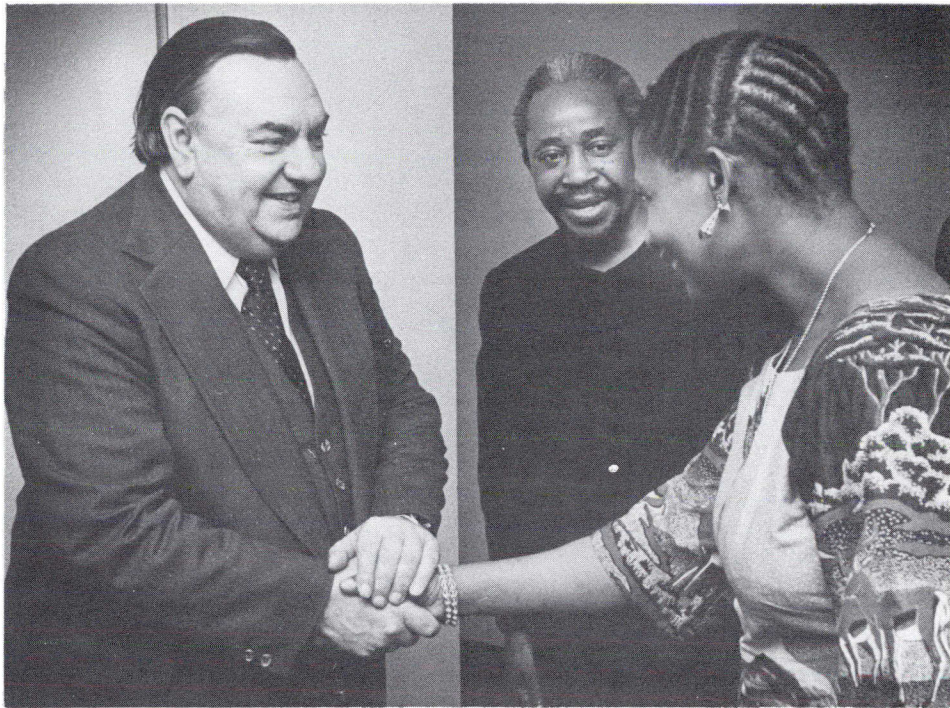
El Ministro de Asuntos Exteriores Don Jamieson da la bienvenida al Alto Comisario de Tanzania, Jefe Mwinamila Lukumbuzya y esposa.

los que sobresalieron: un servicio religioso de varias iglesias el domingo 13; almuerzo parlamentario y cena familiar el lunes 14 de marzo en el edificio del Ministerio de Asuntos Exteriores en Ottawa, durante el cual se sirvieron platos de varios países de la Mancomunidad.