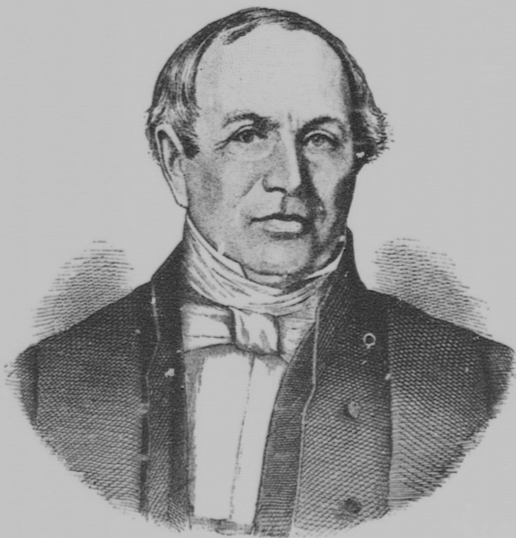
SIR ÉTIENNE-PASCAL TACHÉ