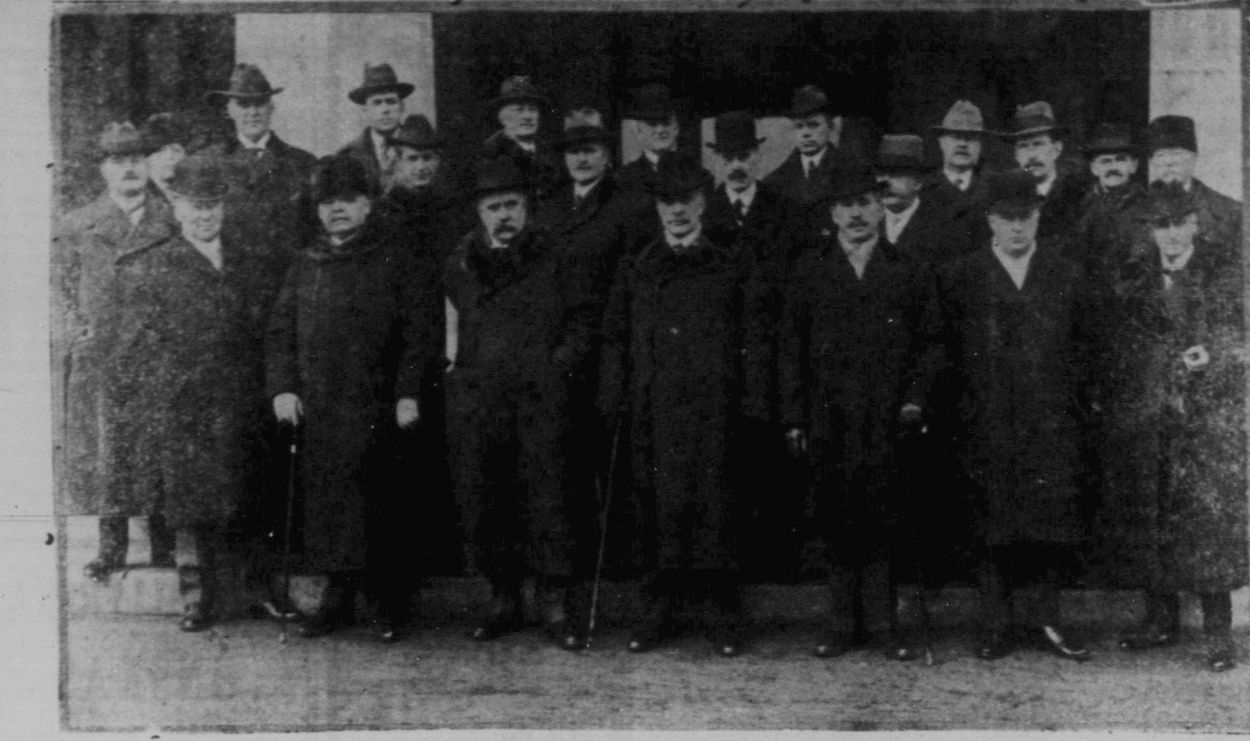
Från premiärministrarnes nylig en hållna möte i Ottawa.