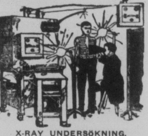
X-RAY UNDERSÖKNING. Intet gissningsarbete.

Ni skall bli fri från svaghet och sjukdom. Kom och hav ett vänligt samtal med mig. Det är ett steg i rätta riktningen och kostar intet. Många av mina patienter resa långa vägar för min speciella behandling och pengarna på billiga postpropositioner, patentmedicin och apotekarläkare. Begå icke detta misstag, utan kom direkt till mitt kontor för en god undersökning. Intet missingsarbete. Ni kan återvända hem efter en vecka. Ett gott rum beredes för eder nära mitt kontor för mycket liten kostnad, så att ni kan erhålla min speciella, direkta behandling.