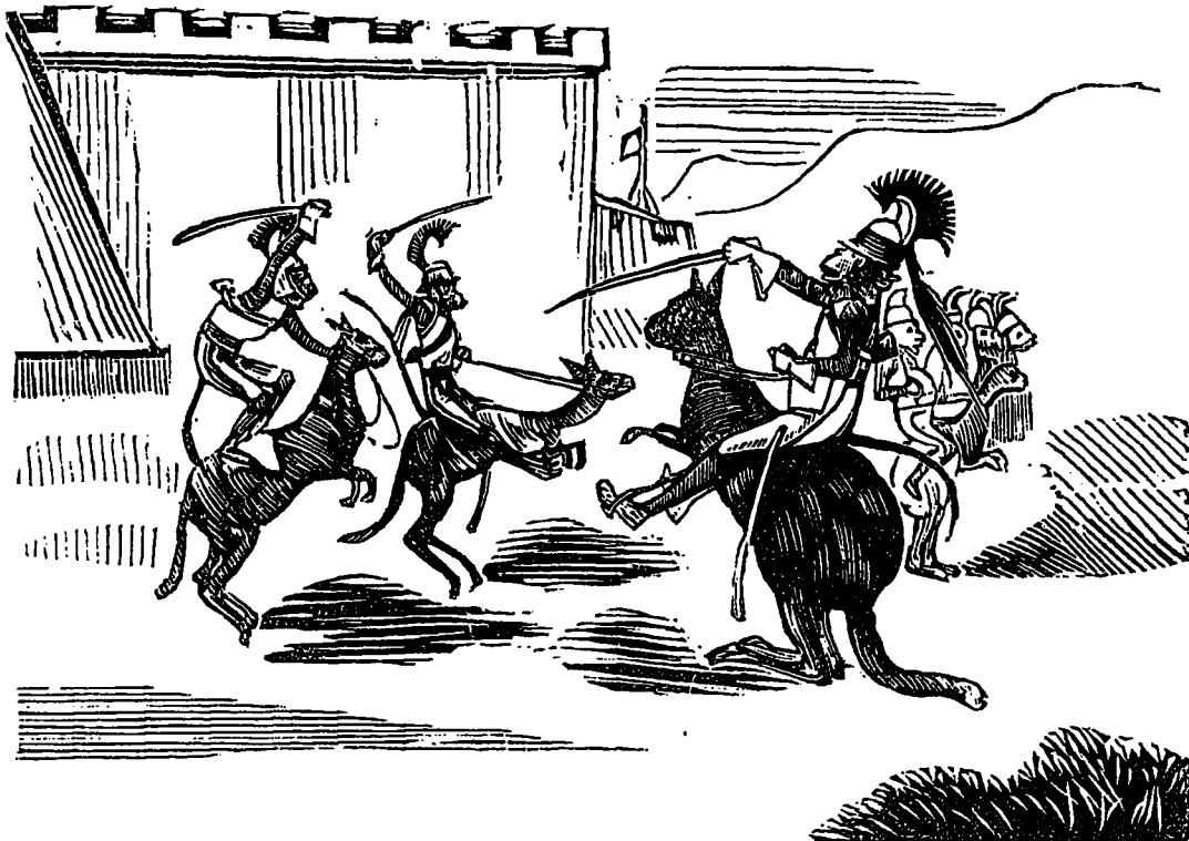
LA CAVALERIE FARANDOULIENNE

Dans les quatre autres divisions militaires les mêmes manœuvres s'exé-