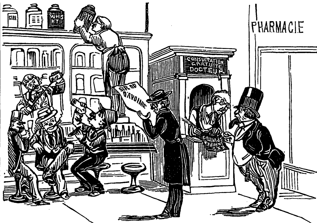
PHARMACIE A DEUX COUPS.

Mot historique. Un prince qui avait alors quelques chances de s'asseoir un jour sur un trône, disait, il y a quelques années avec des actrices parisiennes, Arrivé au dessert et un peu lancé, il émet de grandes idées réformatrices pour le jour où il sera une Majesté. Ah bah ! lui dit sérieusement une Augazon de sa connaissance, vous serez comme les autres quand vous serez chef d'emploi.