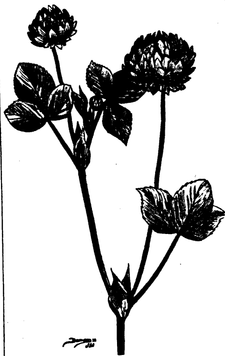
Fig. 13. Haut de tige en fleur du trèfle de Suède au mois de mai.