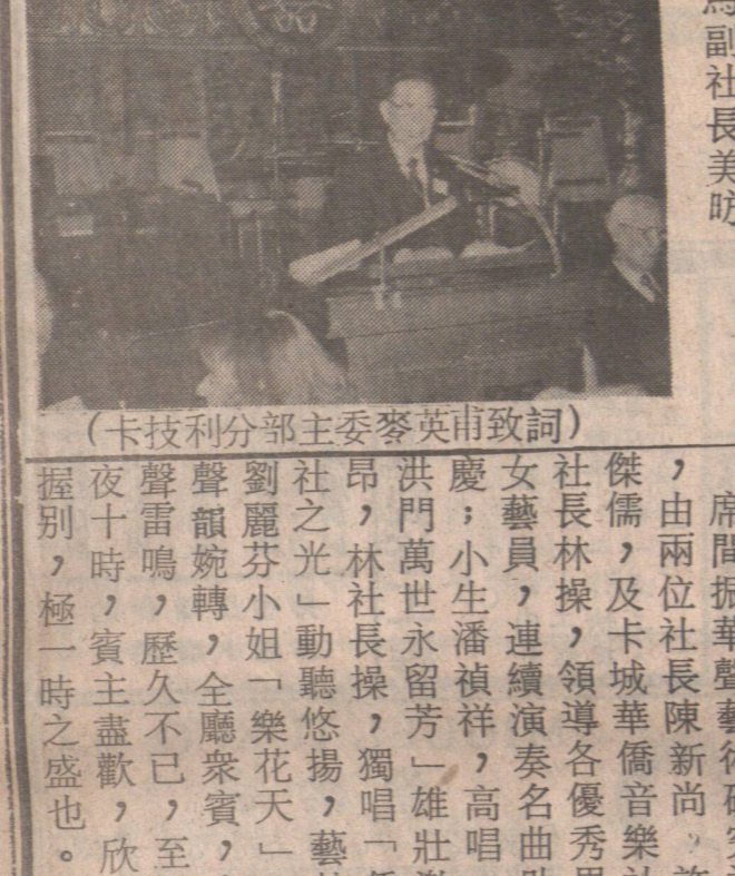
(卡技利分主委麥英甫致詞)