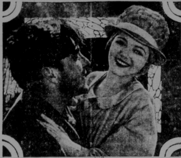
George O'Brien and Janet Gaynor in Sunrise Fox Picture

В ПЯТНИЦЮ, 8. ЛИСТОПАДА, ВІД ГОД. 8.30 ВЕЧЕРОМ В СУБОТУ, 9. ЛИСТОПАДА, ВІД ГОД. 7-01 ВЕЧЕРОМ В УКР. РОБІТНИЧИХ ДОМАХ У ВІННІПЕГУ