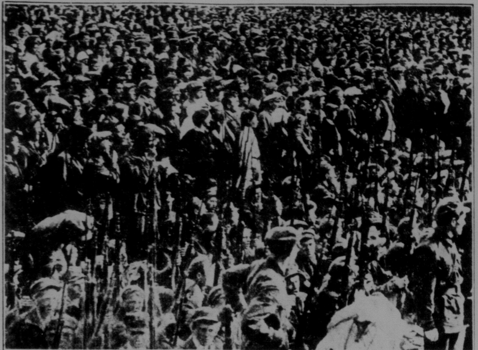
ЗДВИГ РАДЯНСЬКОГО КОМСОМОЛУ В МОСКВІ.

В Харкові, в будинку Ново-Троїцької церкви, на Московській, що її закрили на вимоги трудящих, організує зразковий кіно-театр. Міська рада видала т-ву "друзі радянської кина" 20 тисяч карбованців, як доготривальний кредит на устаткування кина.