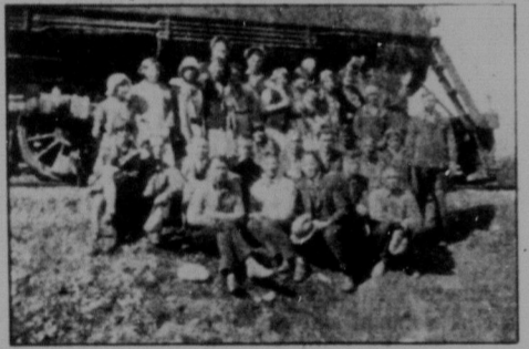
Орхестра в гурті місцевих товаришів перед відвідом з майнерської місцевості Кедомін, Ата.

Програма наша складалася з українських і англійських пісень. Концерт скінчився, а публіка ще чекала, прохуючи, щоб ще заграли до танцю.