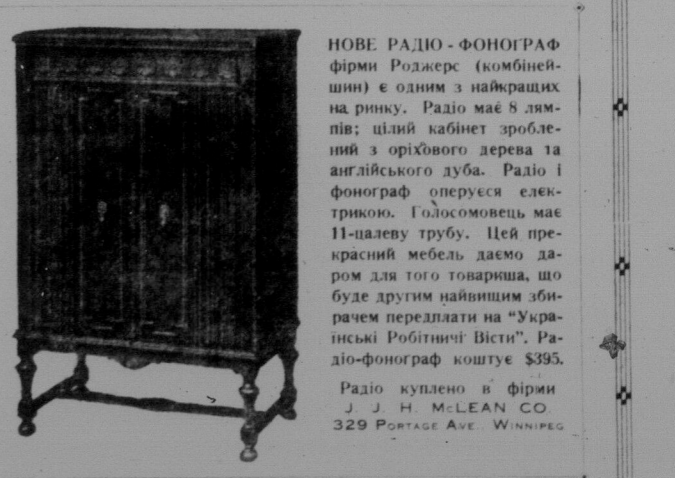
НОВЕ РАДІО-ФОНОГРАФ фірми Роджерс (комбієншин) є одним з найкращих на ринку. Радио має 8 ламп; цінний кабінет зроблений з орехового дерева та англійського дуба.

ТОВАРИШІ! Перш аки візьметеся збирати нову і стару передплату, прочитайте ніше подані умовини, щоби знали, як вам поступати, та щоби відтак не було між вами а адміністрацією ніяких суперечок і спірних питань.