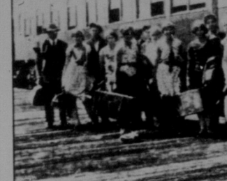
В Едмонтоні — орхестра вернула з обідки й шойно висіла з потуги.

В вівторок товариші й товаришки з Кедомін випроводжали.