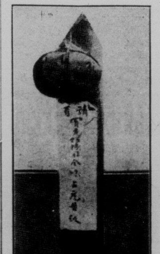
Свята ворогами революції голова радянського китайського робітника прив'язана на вулиці до стовпика з написом: "Так буде кожному революціонеру".

Колись ти казав, що ти ставиш своїм завданням боронити інтереси робітників і селян Китаю, що ти уважаєш своїм обовязком оборонити пролетаріат цілого світа. Тепер ти цього не кажеш. І я думаю, що причиною цьому ти 15 мільонів