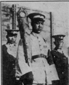
Лист контр-революційного китайського генерала з великим мечем в руці, який відрубе робітничим урядом голови просто на вулиці.

"Недавно я написав твбї листа. Не знаю, чи ти його отримав. З того часу відбулось багато подій, що підтверджували мій погляд на все те, що я з тобою говорив. Пригадую твою фразу. Ти сказав: "Я готовий вмерти за революцію". Нині для мене ясно, що інтереси революції для тебе є ніщо. Тепер я говорю про себе: Я готовий вмерти за революцію, я зриваю всі родинні звязки з тобою, як з моїм батьком.