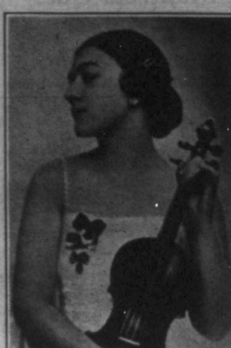
GYARFÁS IBOLYKA magyar hegedűművész.