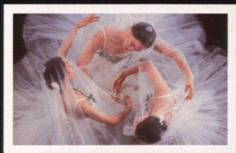
Royal Winnipeg Ballet