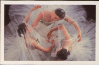
Royal Winnipeg Ballet