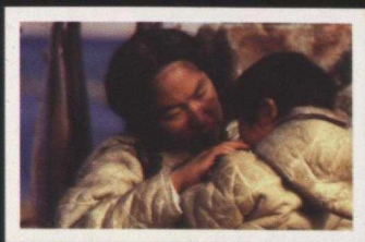
Atanarjuat - The Fast Runner

Dedicated specialists in the Arts and Cultural Industries Promotion Division provide assistance to the cultural sector through a grant program and an international business development program.