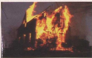
Janet Cardiff and George Bures Miller