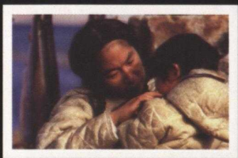
Atanarjuat - L'homme rapide

Des spécialistes dévoués de la Direction de la promotion des arts et des industries culturelles fournissent de l'aide au secteur culturel par l'intermédiaire d'un programme de subventions et d'un programme de promotion du commerce international.