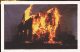
Janet Cardiff et George Bures Miller