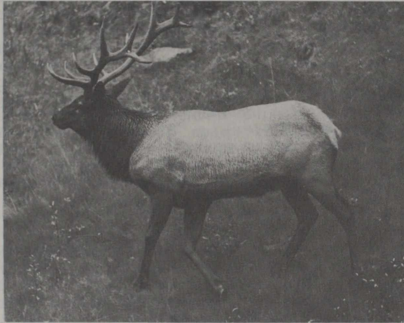
Gros plan d'un orignal solitaire adulte (Parc national de Yoho, Colombie Britannique)

Les provinces assument la plus grande part de responsabilité dans la gestion des ressources fauniques. Elles adoptent et font respecter les règlements qui s'appliquent à la plupart des chasseurs, des trappeurs et des pêcheurs en eau douce. Des problèmes difficiles se posent lorsqu'il s'agit de maintenir l'équilibre entre les intérêts des amateurs de chasse et de pêche, des naturalistes, des cultivateurs, des éleveurs de bétail et d'autres groupes ayant des préoccupations particulières. Chaque province a créé un ministère qui est responsable de l'administration des ressources fauniques et, souvent, de celles d'autres ressources renouvelables telles que les forêts. Les progrès réalisés dans la gestion de la faune reflètent la compétence de ces organismes et l'efficacité de leur personnel, en ce qui concerne les recherches, l'application des règlements ou l'information du public.