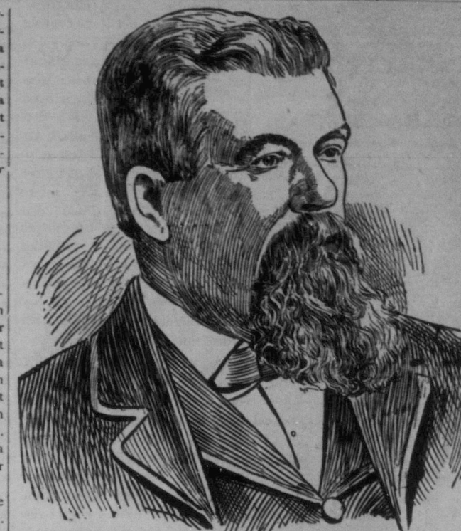
THE HONORABLE THOMAS GREENWAY. Manitobas blifvande premiärminister.

Vädret är det utmärktaste man kan önska och allting växer med avindlande fart.