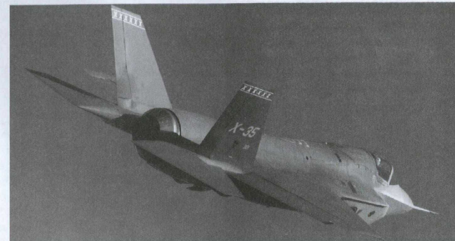
La société Applied Courseware Technology du Nouveau-Brunswick a obtenu un contrat avec Lockheed Martin dans le cadre du projet F-35 Joint Strike Fighter de 270 milliards de dollars.