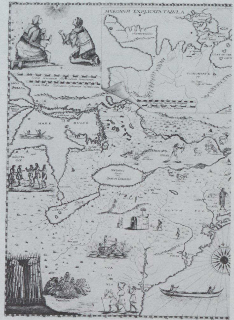
La reciente investigación cartográfica atribuye este mapa de la zona de los Grandes Lagos, con sus escenas de la vida india, hecho en 1957, al Padre Jesuita Franscesco Giuseppe Bressani.

Francia, tal como aparece en el informe Laval y las Relaciones Jesuítas del siglo XIX. La colección de artículos canadienses se mostrará hasta el 3 de junio.