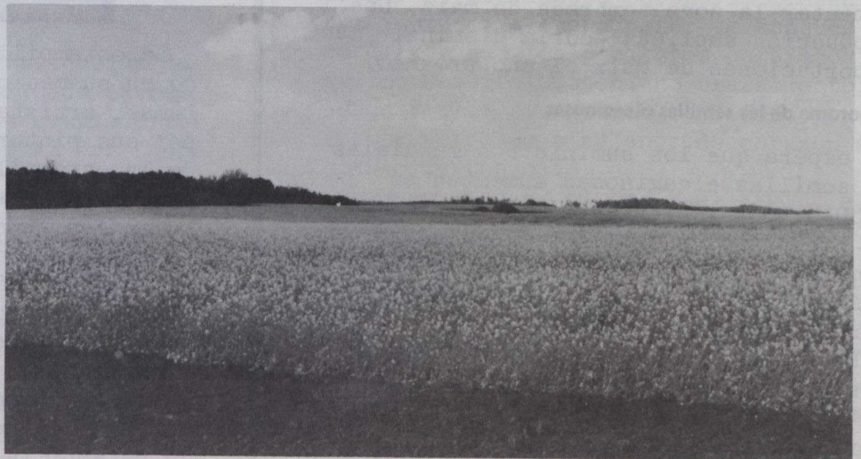
Campos dorados de colza en flor en los llanos

Se espera que el mercado mundial de granos gruesos permanezca elevado a pesar de las limitaciones norteamericanas de las