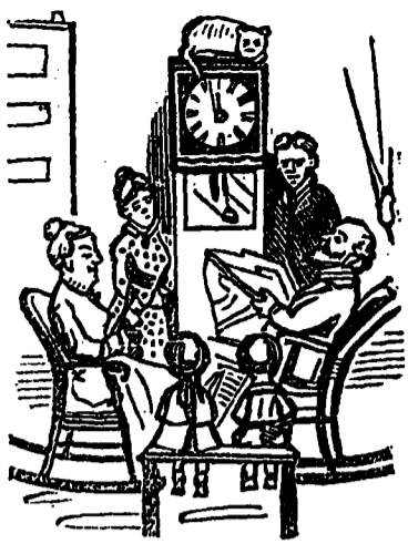
31 DÉCEMBRE 1886—MINUIT MOINS CINQ

Tous les personnages sont d'une sagesse étonnante, attendant cependant, avec impatience, le coup de minuit qui va annoncer la nouvelle année.