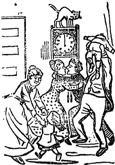
1ER JANVIER 1887—MINUIT JUSTE!

Tous les personnages sont d'une sagesse étonnante, attendant cependant, avec impatience, le coup de minuit qui va annoncer la nouvelle année.