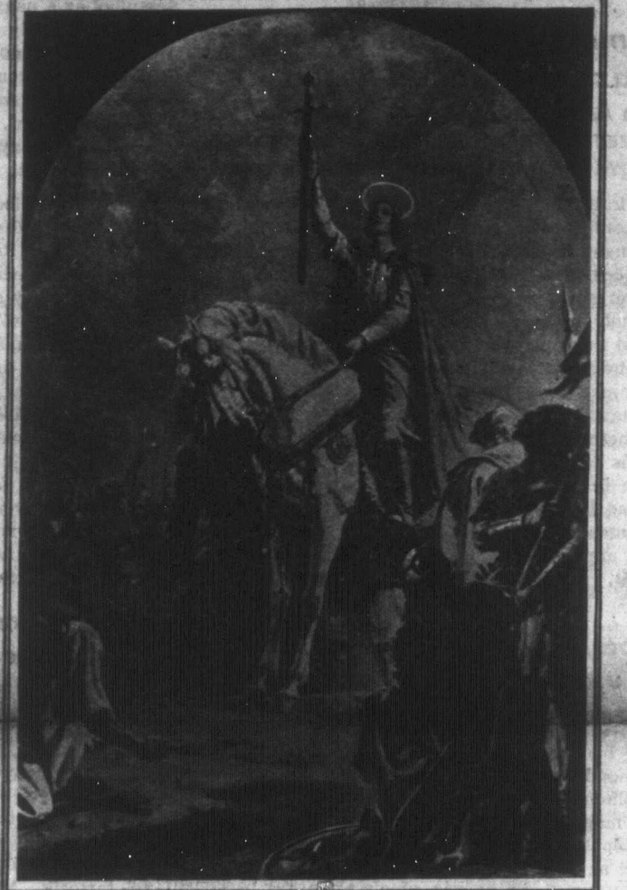
An oil painting by Gyula Merész, exhibited in the Budapest Gallery during the celebrations in memory of the first Magyar Crown Prince, who died in 1031.