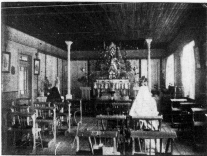
La Chapelle des Religieuses a Alymer.

Après une heure de récréation, à 7½ heures, vient la prière du soir, la récitation en commun du chapelet, chant de cantiques et bénédiction du Très Saint Sacrement.