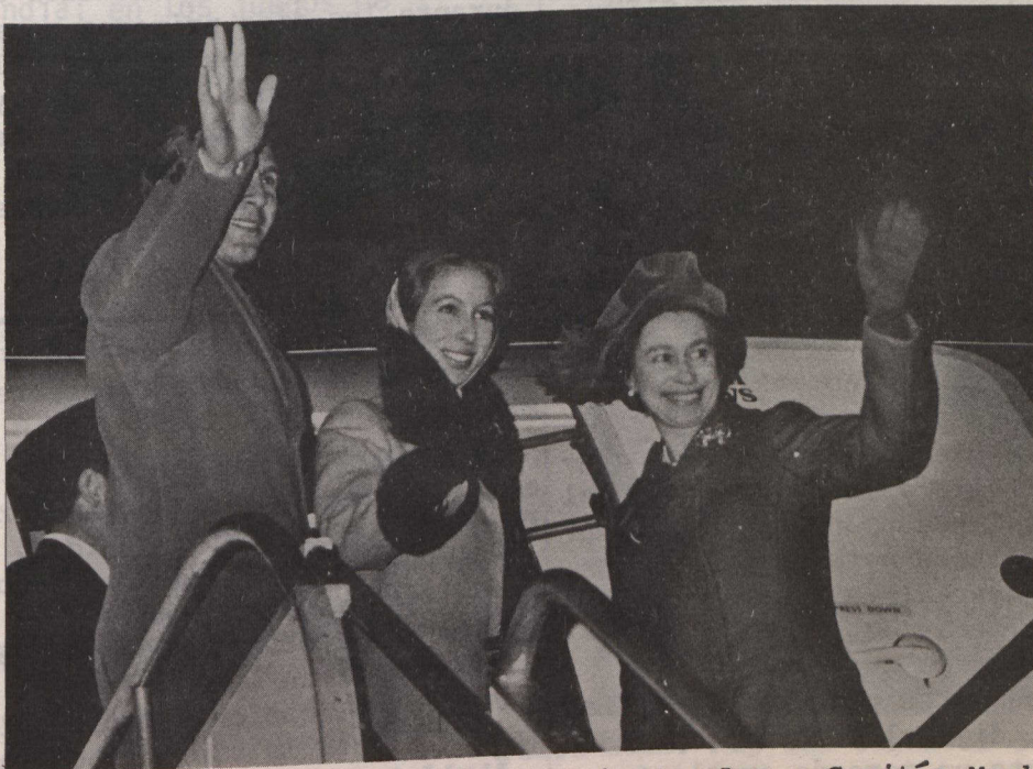
Despedida de la Reina Isabel, Princesa Ana y Capitán Mark Phillips, en el Aeropuerto de Uplands, Ottawa. La Reina estuvo tan solo una hora en el Aeropuerto en su viaje hacia los Juegos de la Commonwealth en Nueva Zelanda.