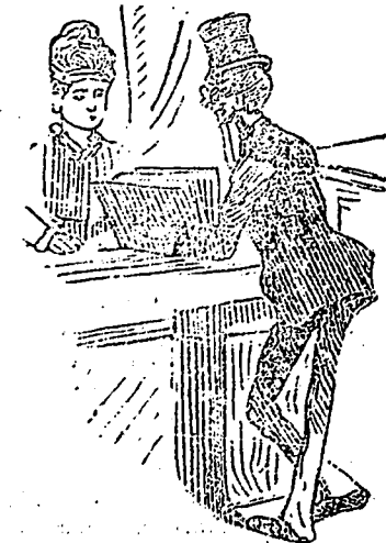
AU MAGASIN DE $1.00.

—Votre choix pour $1. Le "dude" sourit et hésita. La dame "qu'on prend" pas.