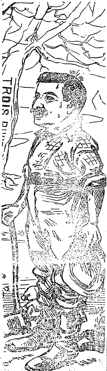
Le Premier Colon de la Province de Québec.

—Votre choix pour $1. Le "dude" sourit et hésita. La dame "qu'on prend" pas.