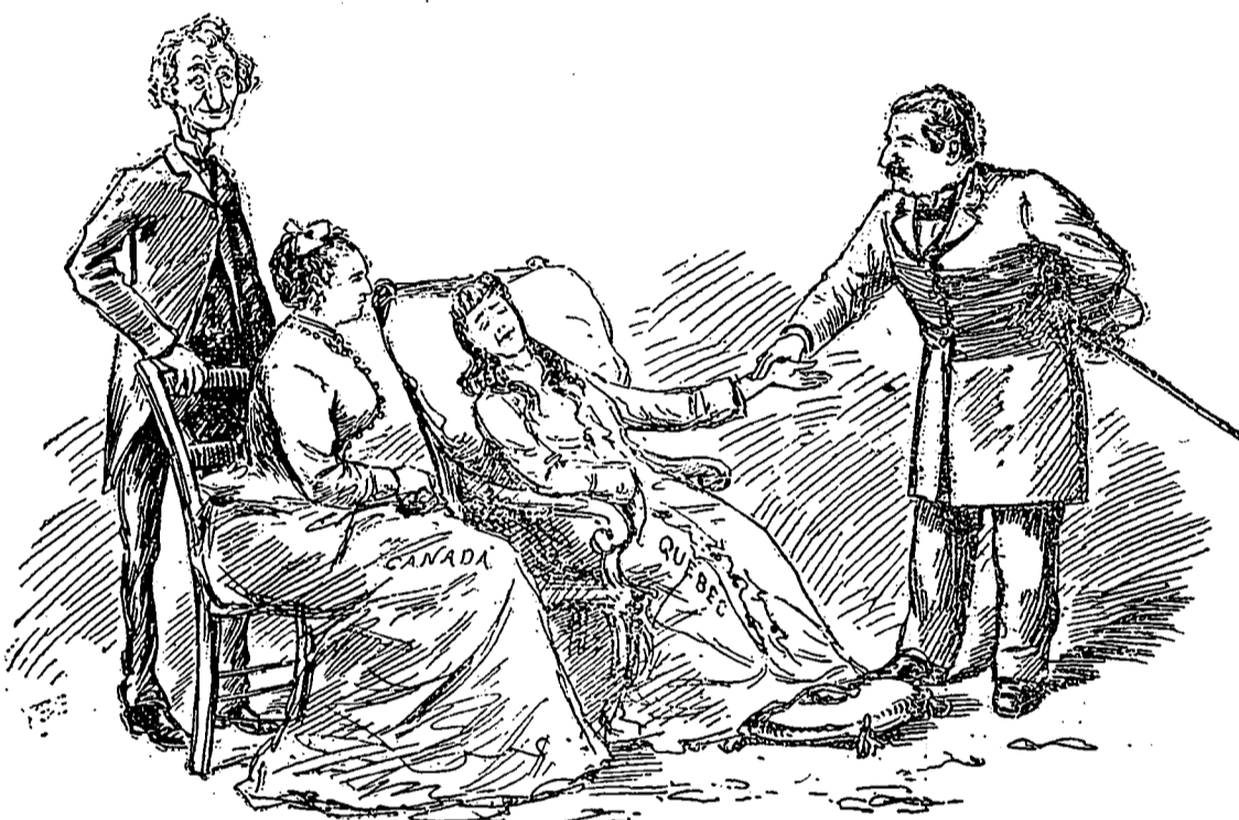
SCENE DE FAMILLE.