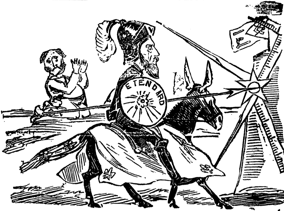
L'ETENDARD ET LA FRANCO-MAÇONNERIE.

— Je vais avec toi, je vais avec toi, je vais avec toi. Qu'est-ce que ça fait, je vais avec toi. Il dut prendre les enfants. Puis il l'aidera à monter. Nous pûmes les suivre sur la crête de la maison. Ils marchaient toutement, elle avait repris dans ses bras les enfants, qui picuraient; et lui, à chaque pas, se retournait, se soulevant. — Mère-la en sûreté, reviens tout de suite ! cria-t-je. Je l'aperçus qui agitait la main, mais le grondement des eaux m'empêcha d'entendre sa réponse. Bientôt, nous les vîmes plus. Les enfants descendus sur l'autre rive, plus bas que la première. Au bout de cinq minutes, ils reparurent sur la troisième, dont le toit devait être très en pente, car ils se traînaient à genoux le long du toit. Une épouvantable foudraine me saisit. Je me mis à erger en mains aux lèvres, de toutes mes forces : — Il n'y a rien ! reviens ! Et tous, Pierre, Jacques, Gaspard, leur coururent aussi de reviens. Nous vîmes les arrêter une minute. Ma