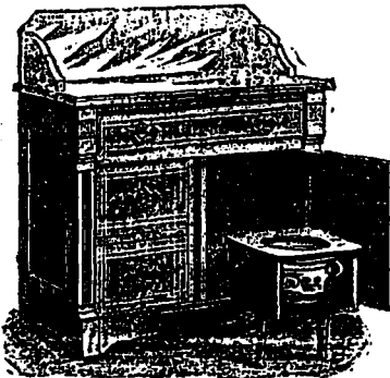
Breveté Janv. 15 1884. Marque de fabrique enregistrée

Les Cabinets Universels sont non-seulement indispensables dans la chambre de l'invalidé, mais aussi dans toutes les chambres de la maison.