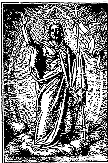
Le Christ vainqueur de la mort et de l'enfer.

se laisse arrêter ou déconcerter ni par les difficultés, ni par les épreuves ou les revers. Il est fidèle, et ne trahit jamais la cause dont il connaît la justice et les revers qu'elle peut subir ne font que l'y attacher davantage. Il est actif et vigilant, il ne se laisse pas endormir dans l'illusion d'une fausse sécurité ; loin de fermer les yeux sur le danger, il l'épie, et ne craint pas de se voir dans l'obligation de sortir de son repos et de donner des preuves de son dévouement. Il est généreux ; en latin, il s'appelle la magnanimité parce qu'il suppose dans l'âme des sentiments élevés, l'amour spontané de tout ce qui est bien, de tout ce qui est beau, de tout ce qui est grand, et le dévouement à ces saintes causes l'élevant au-dessus de toute crainte, et le rendant supérieur à la séduction comme à la menace, le dispose à tout tenter pour elles et à tout souffrir. Enfin le courage chrétien