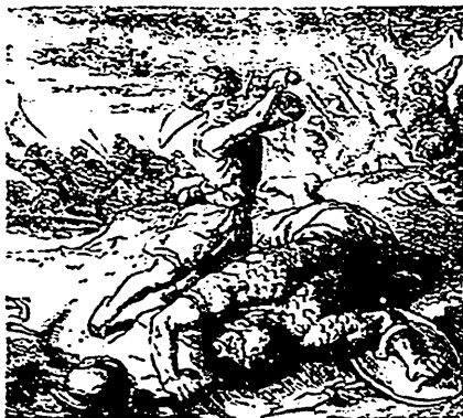
David coupant la tête de Goliath.

justice. Il est prudent, sage, réfléchi, car il est trop désireux du triomphe de la bonne cause pour l'exposer témérement. Il est constant : fruit des profondes et puissantes convictions par lesquelles l'intelligence entraîne la volonté, il ne change point suivant le souffle de la faveur ou les caprices de l'opinion. Il est persévérant et ne