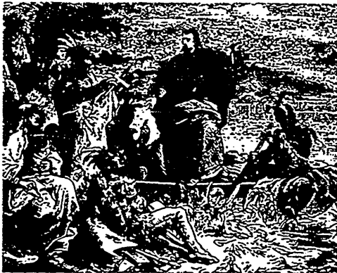
Le P. Marquette, S. J., à la recherche du Mississipi.

“ Salut à toi, sur les plages inhospitalières des pays sauvages, dans les hôpitaux et dans les bagnes où, sous l’humble costume du Missionnaire ou de la Sœur de Charité, tu te dévoues jusqu’à la mort, au soulagement de la souffrance, au salut des âmes, à la propagation de l’Evangile et de la civilisation !