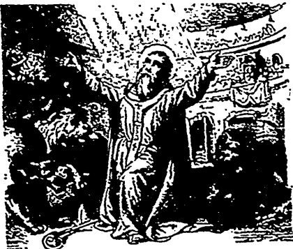
Saint Ignace, martyr.

“Salut à toi dans l'ardente mêlée des luttes politiques, ou dans les labeurs des affaires publiques, en la grande âme de cet homme droit, dévoué au bien de son pays, que ni les clameurs de la foule, ni les regards irrités du tyran, ni les gémissements de l'intérêt personnel ne font dévier du droit sentier du devoir et de l'honneur !