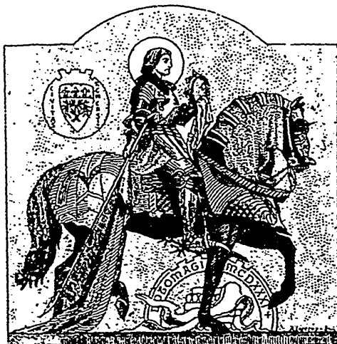
La Vén. Jeanne d'Arc.

“Salut à toi, belle et noble vertu des grandes âmes !