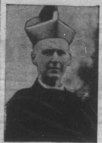
FALLON WINDSORI PÜSPÖK.

Április 5-én Husvétvasárnapján délelőtt 10-kor ünnepi istentisztelet s