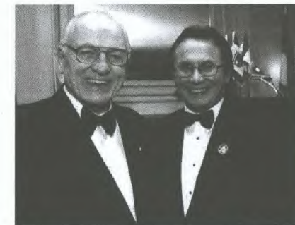
De gauche à droite, le consul général du Canada à Boston, Ronald Irwin, et le vice-premier ministre des T.N.-O., Jim Antoine, au Maple Leaf Ball pour présenter les diamants des T.N.-O.

Au terme de cette campagne aux États-Unis, tous les partenaires ont fait part de leur désir d'élargir les activités de promotion des diamants des T.N.-O. aux États-Unis en 2004. Pour plus de renseignements , communiquez avec