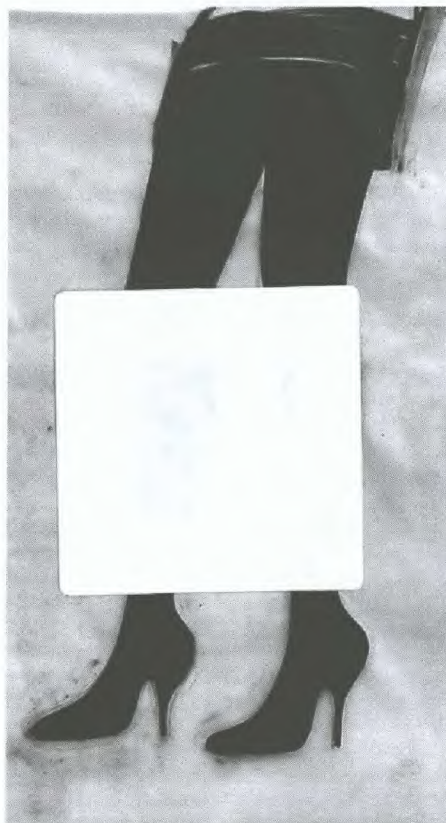
Untitled, de Cathy Daley, Newzones Gallery à Cagary (participante à l'Affordable Art Fair).

Les participants ont eu l'occasion de rencontrer des représentants importants du secteur, qui leur ont donné des renseignements et des conseils sur les divers aspects du marché de l'art, dont un aperçu général du monde de l'art actuel à New York, des conseils sur la manière de générer de la publicité ainsi