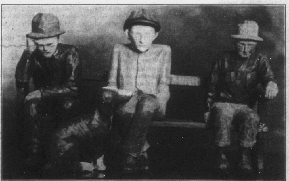
Három busuló munkanélküli gondjait tükrözi vissza egy szintén kereset nélkül tengődő munkás fából faragott művészi szoborcsoportja, melyet a minap küldtek be a "One Big Union Bulletin" című szakszervezeti lap szerkesztőségébe.