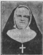
Mère Marie-Léonie, fondatrice