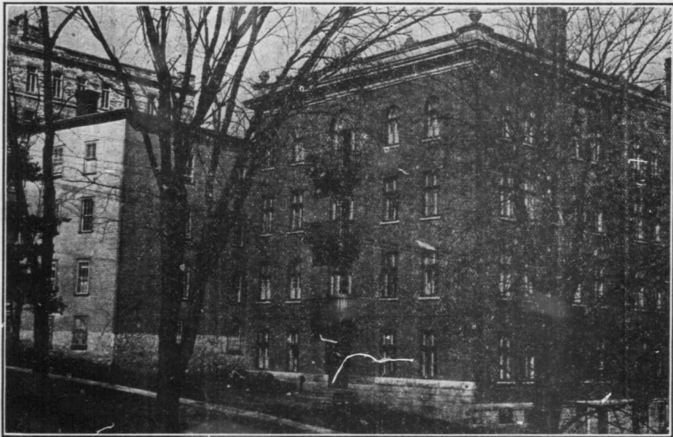
Maison-Mère et Noviciat des Petites Sœurs de la Sainte-Famille (2 e partie)