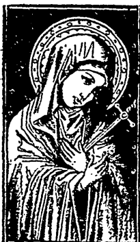
S.-D. des Sept-Douleurs (28 sept.)

Bulletin de Septembre 1890. — 1 re Partie.