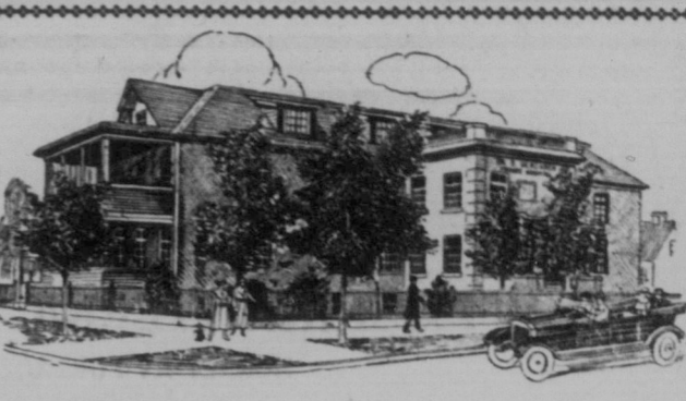
Natt och dagbed besvaras skyndsamt. Kontorstimmor: 9-12 Söndagar 1-6 3-12 1-3 2 6