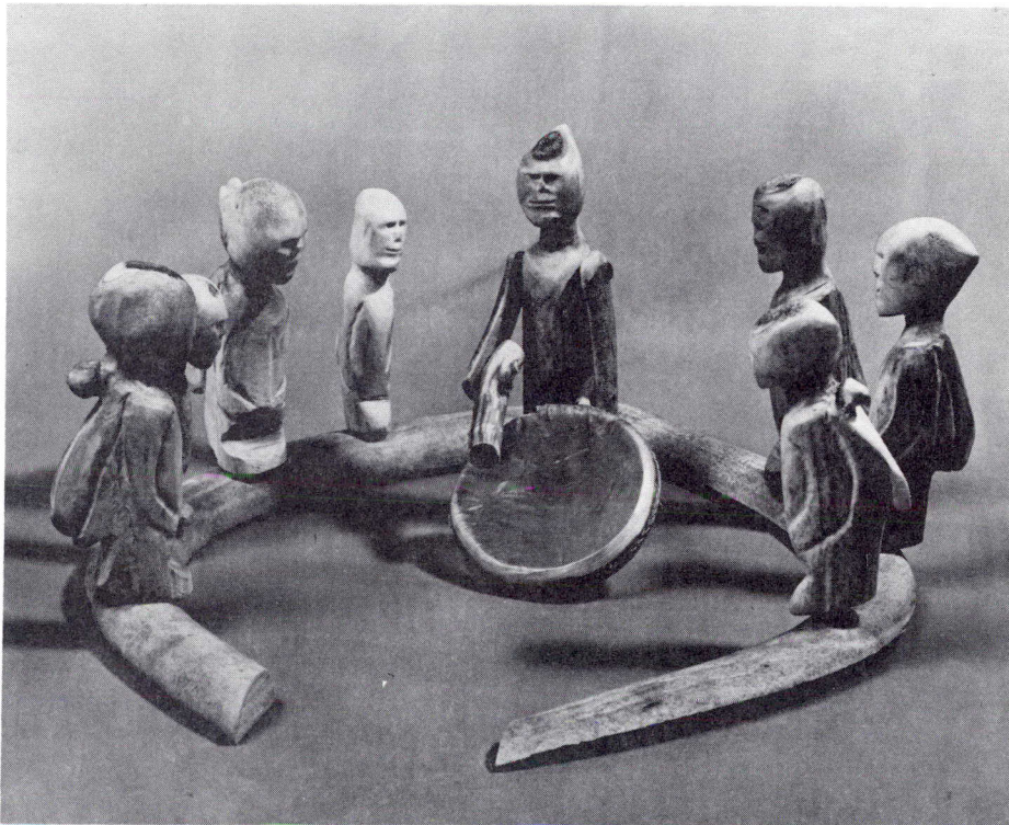
Reunión de la Danza del Tambor, obra de Luke Iskiktaaryuk. (Asta de caribú, 1972).

Pueblo Intimo, Arte de Lake Baker, es una exposición fascinante parte del festival de cultura canadiense durante los Juegos Olímpicos; refleja la labor de ocho artistas inuit de la Cooperativa Sanavik de Lake Baker en los Territorios del Noroeste.