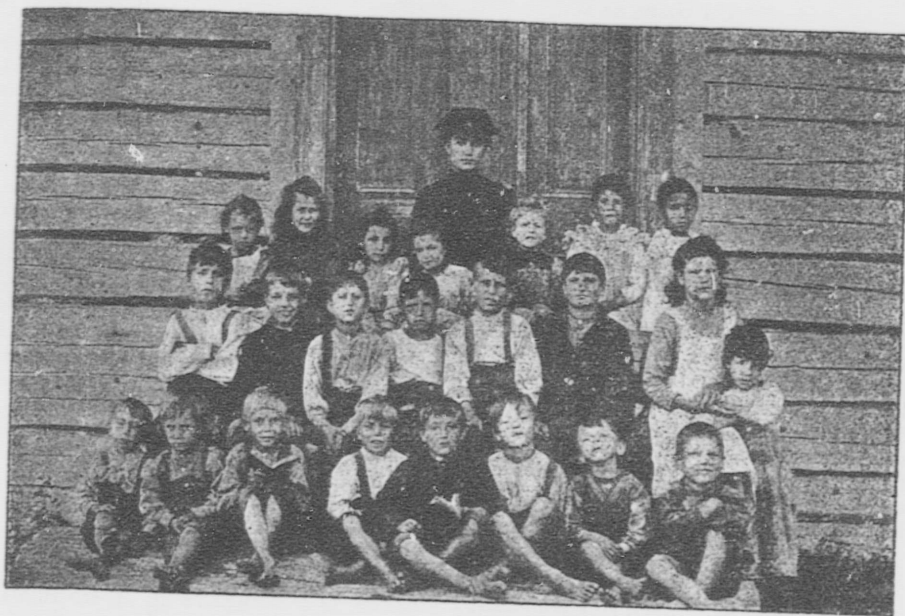
ÉCOLE DU GROS-MORNE (Gaspé)