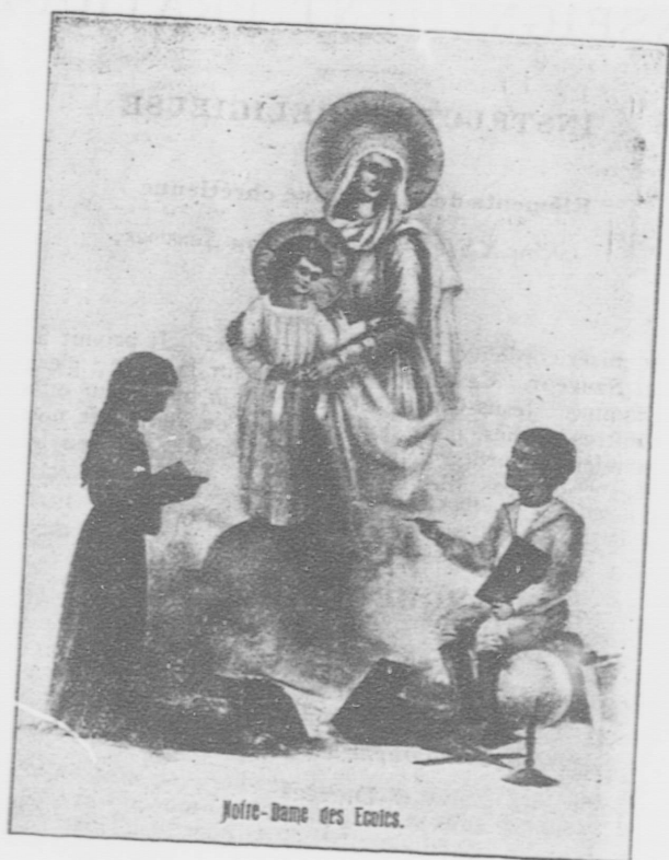
Notre-Dame des Ecoles.

L'Enseignement Primaire est heureux d'offrir à ses lecteurs une reproduction fidèle de l'image de Notre-Dame des Ecoles . Cette dévotion est en honneur chez les élèves institutrices de l'École normale de Montréal, dirigée par les Sœurs de la Congrégation de Notre-Dame. En cette année jubilaire consacrée par Sa Sainteté Pie X à Marie Immaculée, il convient de faire honorer la Très Sainte Vierge tout particulièrement par les enfants des écoles.