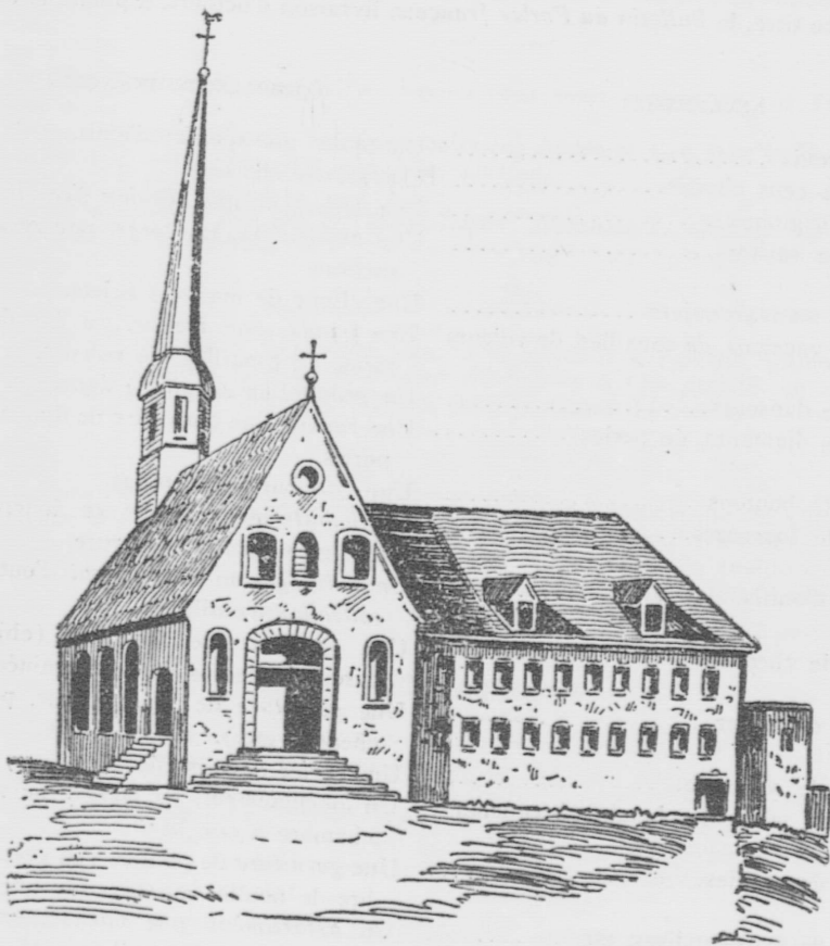
ANCIENNE ÉGLISE ET VIEUX COUVENT DES RÉCOLLETS, À QUÉBEC