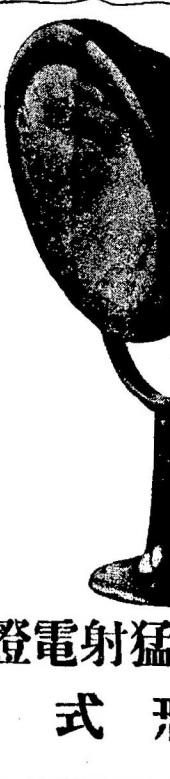
HONG WO & CO. STEVENSON & CO. 市姊妹同和號啟

啟者。小。店。與。電。公。司。訂。立。合。約。製。得。有。光。猛。射。燈。專。為。同。胞。之。家。鄉。防。禦。賊。盜。起。見。用。法。之。便。誠。為。近。世。之。罕。見。也。更。能。射。高。低。旋。轉。左。右。與。及。開。放。久。暫。隨。意。所。欲。其。光。能。射。數。里。之。遙。其。燒。電。之。廉。亦。為。別。樣。燈。之。所。無。每。次。用。電。八。枝。可。燃。四。閱。月。之。久。每。枝。金。銀。五。毛。合。計。一。月。僅。燒。去。電。七。毫。五。仙。其。外。火。水。燈。煤。石。煤。等。每。月。少。少。然。燒。由。拾。五。元。至。二。十。元。煤。石。燈。燃。燒。之。重。用。工。之。煩。瑣。諸。各。同。胞。皆。有。所。聞。凡。各。同。胞。欲。保。家。鄉。者。不。可。不。建。築。礙。樓。者。不。可。不。購。置。此。電。射。燈。也。礙。樓。者。不。可。無。眼。光。無。眼。者。雖。有。楚。項。羽。之。勇。無。從。施。其。術。也。望。同。胞。留。心。定。購。方。有。貨。交。也。 丁。丁