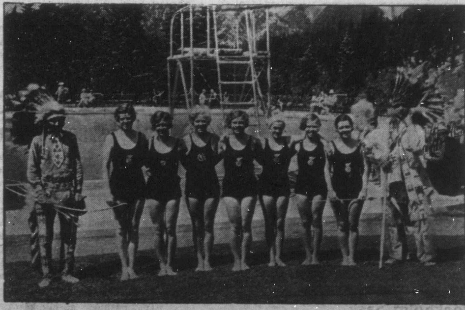
Kanada hét válogatott nősőzője áll glédában ezuttal olvasóink előtt. A Rocky Mountains legfestőbb fürdőhelyén, az albertai Banff-en pihenetek meg az edzett női atléták, a los-angelesi versenyek izgalmai előtt. — A két rézbőrű indiai szerepéről nem számol be a krónika s nem tudjuk, hogy vajjon a kíváncsiszókodokat akarják-e távol tartani nyilakkal, vagy pedig csupán még harcra sabbá akarták tenni az amazonok megjelenését?

— Micsoda? Fizetésemlést? Örüljön, hogy a könyvelőm lehet... De figyelmeztetem, ha még egyszer elégedetlenkedik, társnak veszem! Megértette?!