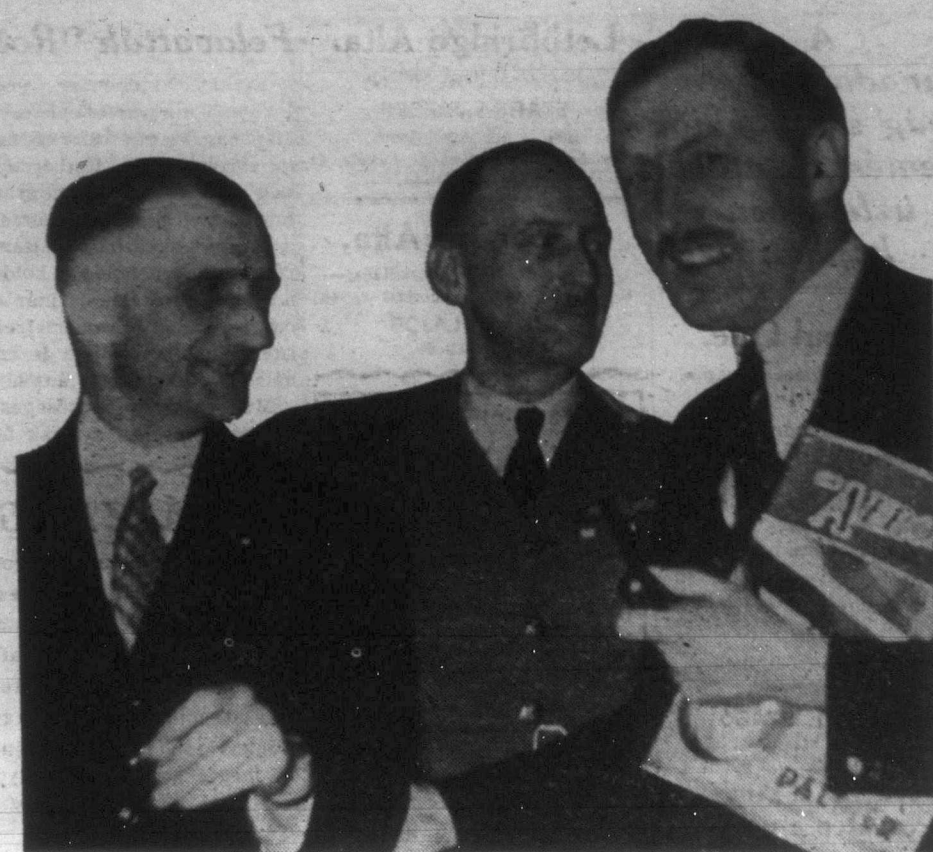
Grönaui német pilóta immár harmadikszor repült át az Atlanti Óceánon és múlt héten szerencsésen megérkezett Montrealba. A "Grönland Wahl" azaz a grönlandi bálna nevű egyfedélű óriási vízirepülőgépen a pilótán kívül még egy megfigyelő, egy rádiókezelő és egy motorszerelő is érkezett, akik először Labrador partjai mellett értek kanadai vizet. Képvonk Grönaui Ottawában kanadai repülőbiztonsági társaló, akik ellenfelei voltak a háborúban. A híres német pilóta Winnipeg érintésével Vancouverbe is készül, honnan a los-angelesi Olimpiász felé veszi útját.

Mint a "Lancet" című angol orvosi lapból értesülünk, néhány tudós meg akarta vizsgálni, hogy valóban vannak-e krokodilkönyvek? A tudósok több krokodil szemébe hagymalevet csöppentettek és várták a hatást. A krokodilok nem könynyeztek. Sőt. Keservesen fanyarul elvigyorogták magukat. Krokodilkönyv tehát nincs. Egy legendával tehát ismét szegényebbek lettünk és nem foghatjuk többé embertársainkra, hogy krokodilkönyveket ejtenek