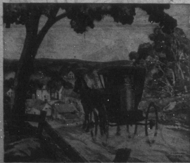
"New-Brunswicki táj" — ezt a címet adta Phillips neves kanadai festő a fent bemutatott festménynek, mely a keletkanadai tengerparti tartomány egyik kedves tanykás vidékét örökíti meg.

A paradicsomot ápaszírozva tűzre tesszük s mikor felforr, adunk hozzá egy kis vöröshagymát